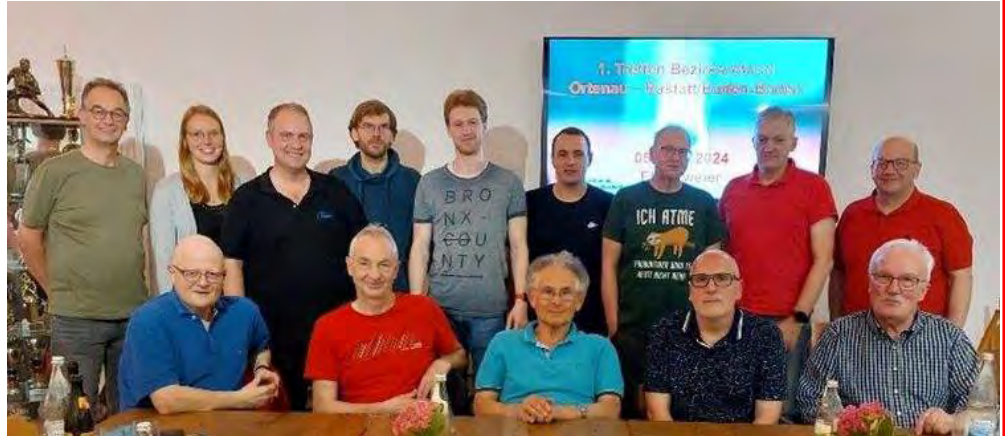
Foto: Vertreter der Bezirke Ortenau und Rastatt/Baden-Baden bei dem gemeinsamen Treffen

Den vollständigen Bericht finden Sie hier: Startschuss zur Bezirksreform in den Bezirken Ortenau und Rastatt/Baden-Baden - Tischtennis Baden-Württemberg (ttbw.de)