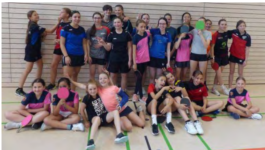
Eine lustige & motivierte Schar an Mädchen beim Ulmer Trainingstag

Auf unserer Homepage finden Sie den vollständigen Bericht: Mädchentainingstag mit 26 Teilnehmerinnen – wieder ein voller Erfolg! - Tischtennis Baden-Württemberg (ttbw.de)