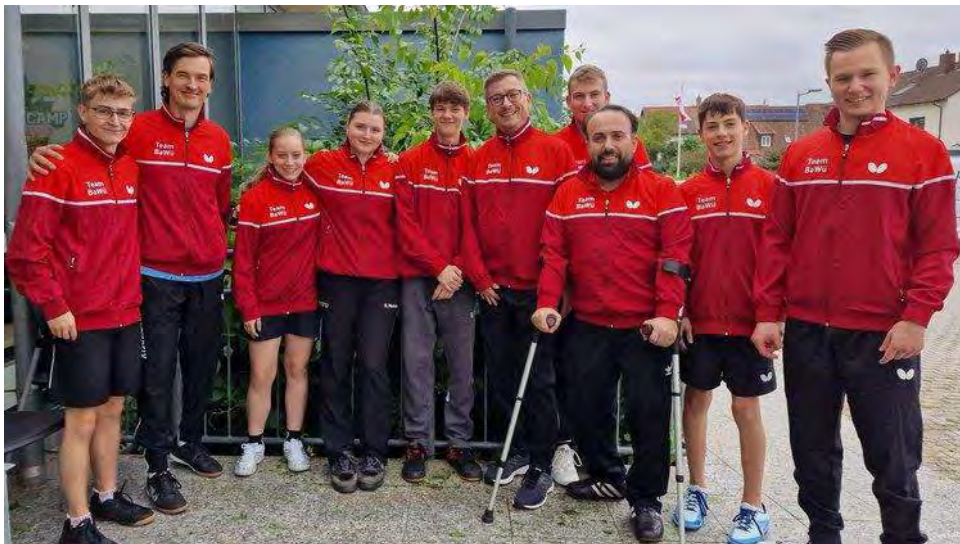
Das Team Württemberg in Speyer

Team Württemberg muss sich heuer mit Platz 13 begnügen - Tischtennis Baden-Württemberg (ttbw.de)